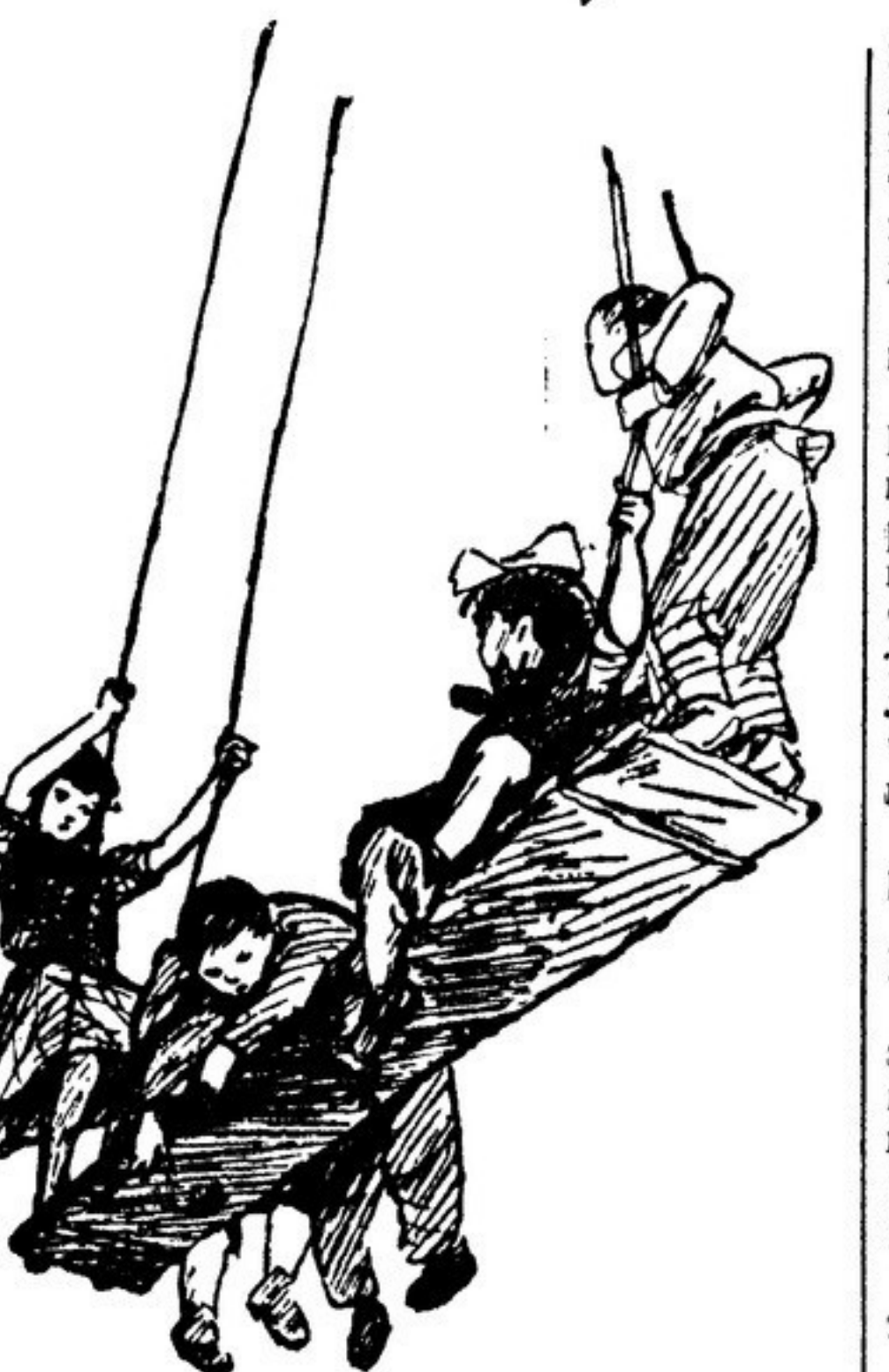
Иллюстрация В. Горького к книге А. Барто «Качели» (Детгиз).

В стихотворении «Вязанье» все увлечение вязанием, и маленький мальчик утасовывает дух пушистых ценит, чтобы сесть на «кроточную» их и не связала из них что-нибудь. А. Барто хорошо знает детские увлечения — увлечения прыганьем через веревочку, сбором металла, вязаньем. Это вовсе не пустяки, потому что дети